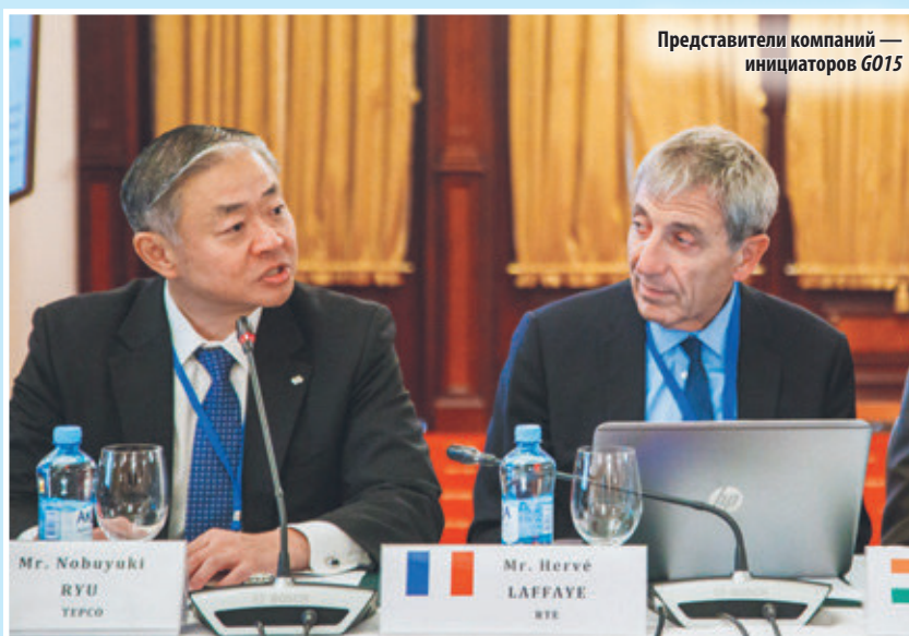
Представители компаний — инициаторов G015