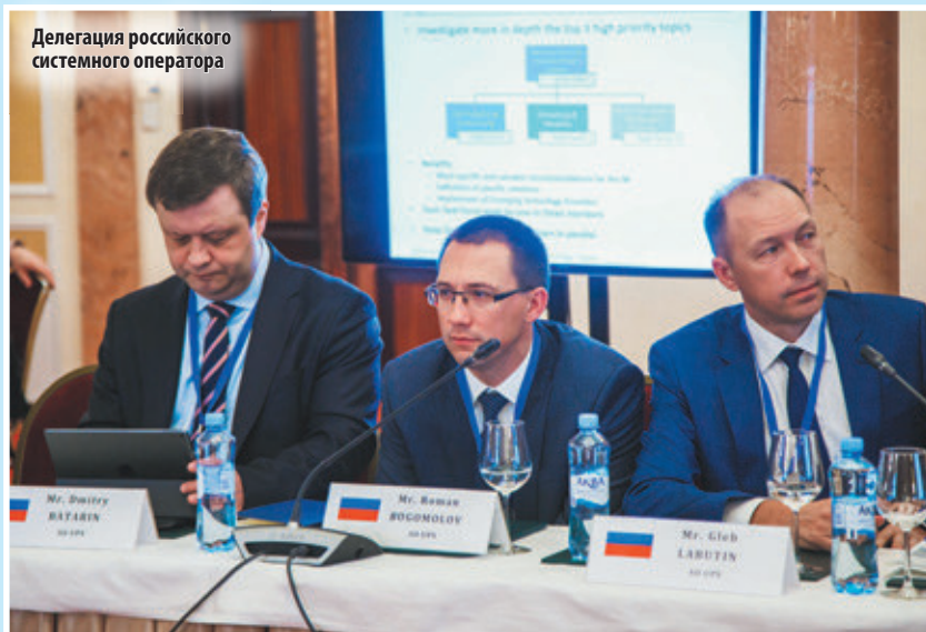
Делегация российского системного оператора