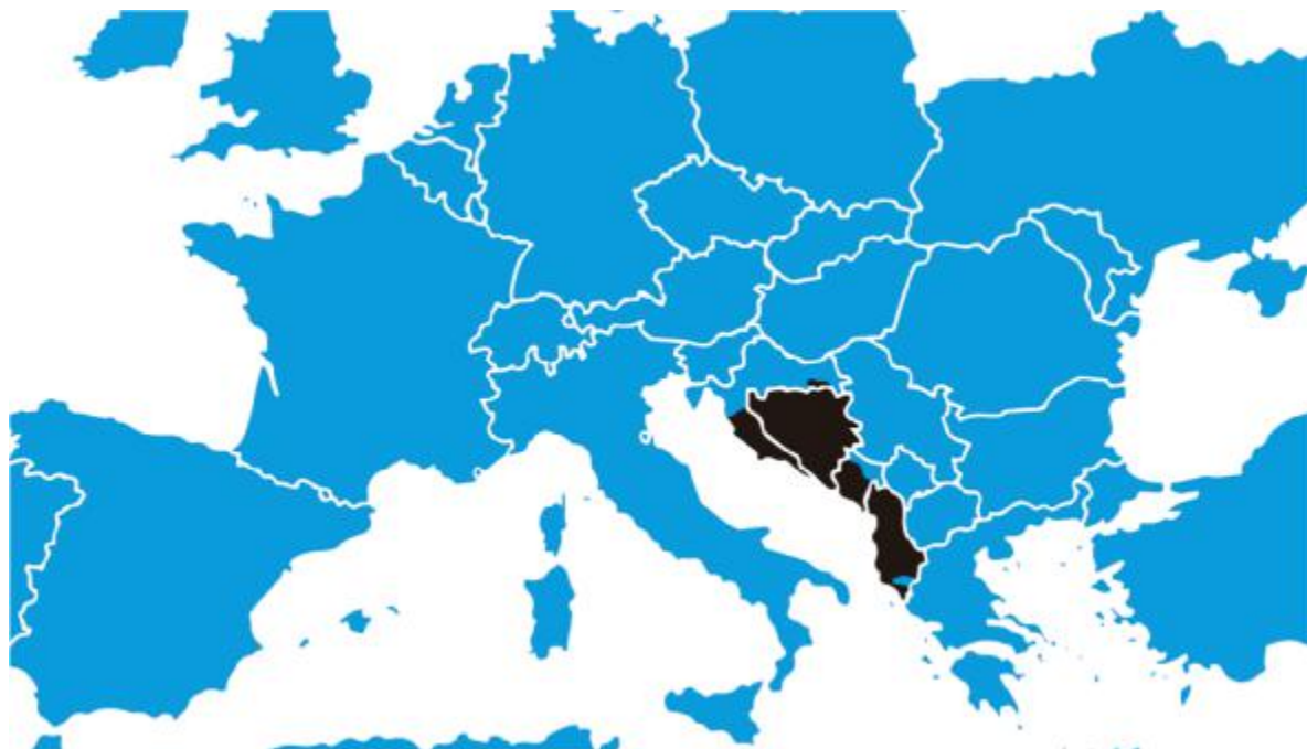
Рис 1. Географический район, затронутый системной аварией 21 июня 2024 г. (выделен черным цветом).

ENTSO-E, ACER, отраслевые регулирующие органы и системные операторы (TSO's) энергосистем, расположенных в юго-восточной части Континентальной Европы, провели первое заседание совместной экспертной группы по расследованию причин системной аварии, произошедшей 21 июня 2024 г., которая привела к масштабному отключению потребителей в Албании, Черногории, Боснии и Герцеговине, а также частично в Хорватии.