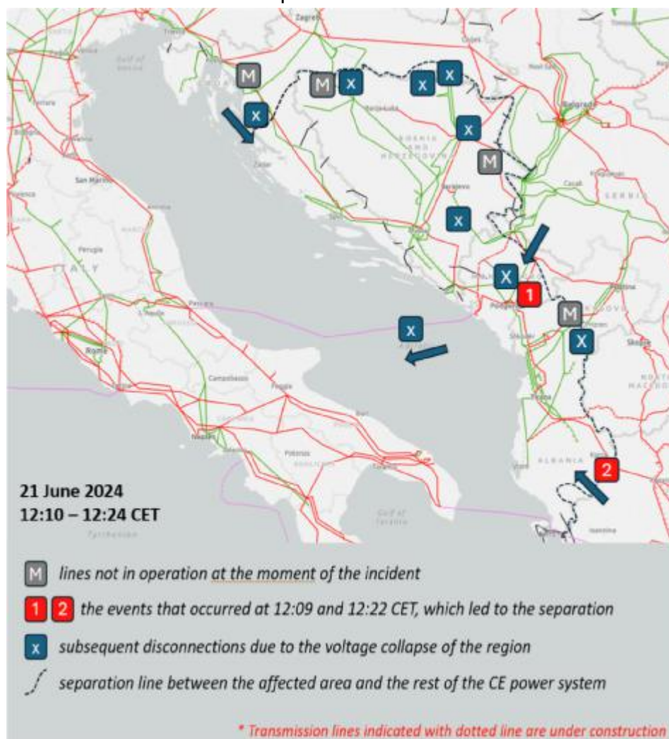
Рис. 2 Последовательность развития аварийной ситуации 21 июня 2024 г.

2. В 12:22 в результате короткого замыкания произошло отключение ВЛ 400 кВ Земблак – Кардия между Албанией и Грецией. Таким образом, оба отключения привели к нормативному возмущению, соответствующему критерию надежности N-2 с несколькими нарушениями нормального режима работы энергосистемы с точки зрения нагрузки на ВЛ и уровня напряжения. Отключение ВЛ 400 кВ Земблак – Кардия привело к падению напряжения в юго-восточной части энергосистемы Континентальной Европы.